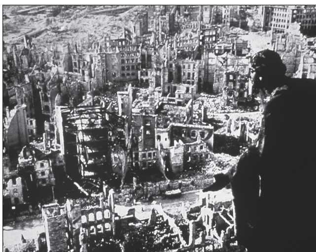
Дрезден след бомбардировките на Съюзниците, 1945 г.