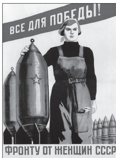
Съветски плакат: „Всичко за победата! За фронта от жените на СССР“

4 Разгледайте изображенията и аргументирайте защо Втората световна война се определя като „тотална война“.