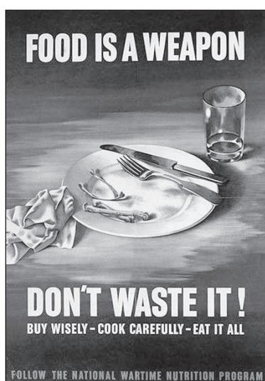
Американски плакат: „Храната е оръжие. Не я разхищавайте! Пазарувайте разумно! Гответе внимателно! Изяждайте всичко! Следвайте националната военновременна програма за изхранването!“