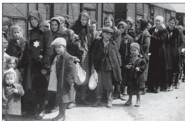
Унгарски евреи в Аушвиц, 1942 г.