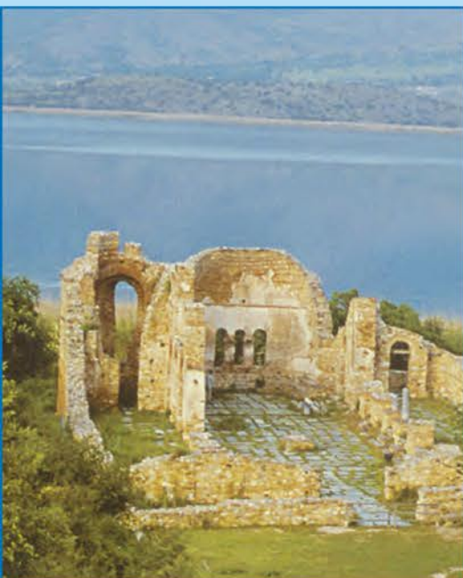
2 Останки от базиликата „Св. Ахил“ . В нея бил погребан цар Самуил. Намира се на остров в Преспанското езеро (дн. Гърция). В гр. Преспа били построени дворец и църкви.