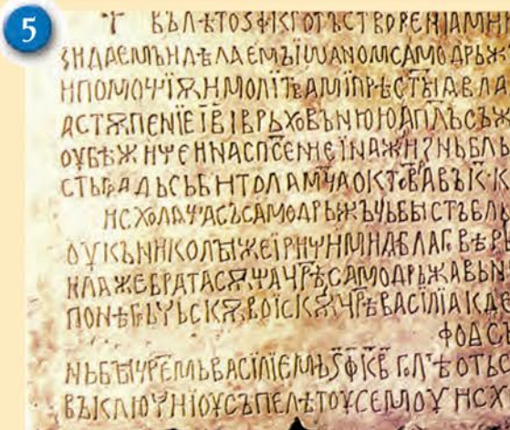
5 Нагпис на цар Иван Владислав (1015–1018), открит в Битоля, 1015 г. ...Обнови се тази крепост, зидана и правена от Иоан, самогържец български... Тази крепост бе направена за убежище и за спасение и за живота на българите... Този самогържец беше българин по род, внук на Никола... син на Арон, който е брат на Самуил.